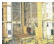
AS/RS แบบเก็บวัตถุที่มี น้ำหนักมาก