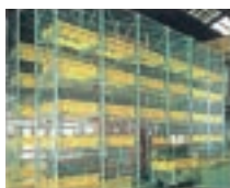
AS/RS แบบเก็บแม่พิมพ์