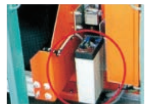
เลเซอร์วัดระยะ (อุปกรณ์ขึ้นลง)

ไม่ว่าจะเป็นรุ่น Side clamp หรือ รุ่น Twin Fork ฯลฯ ที่เป็น Line Up สินค้าของเราสามารถ Handling สินค้าได้ทุกขนาด