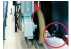
เลเซอร์วัดระยะ (อุปกรณ์วิ่ง)

เสียงรบกวนน้อยขณะทำงาน เนื่องจากใช้ล้อยูรีเทนและราง อลูมิเนียม