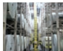
AS/RS แบบเก็บวัตถุทรง โรล/ม้วน