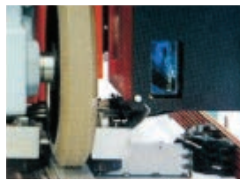
ล้อยูรีเทนและยางอะลูมิเนียม (วิ่ง)

ใช้เลเซอร์วัดระยะในการกำหนด ตำแหน่งการวิ่งและการขึ้นลง มีความแม่นยำในการหยุดสูงด้วย การวัดระยะแบบเรียลไทม์