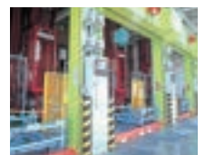
AS/RS แบบเก็บวัตถุ อันตราย